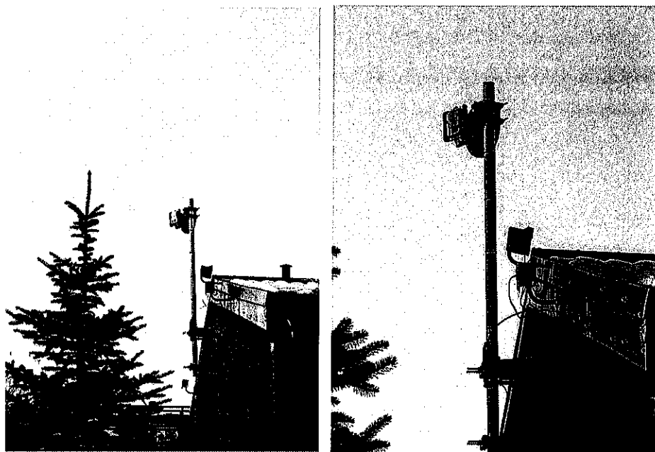
Widok obiektu wraz z zainstalowanym zespołem antenowym