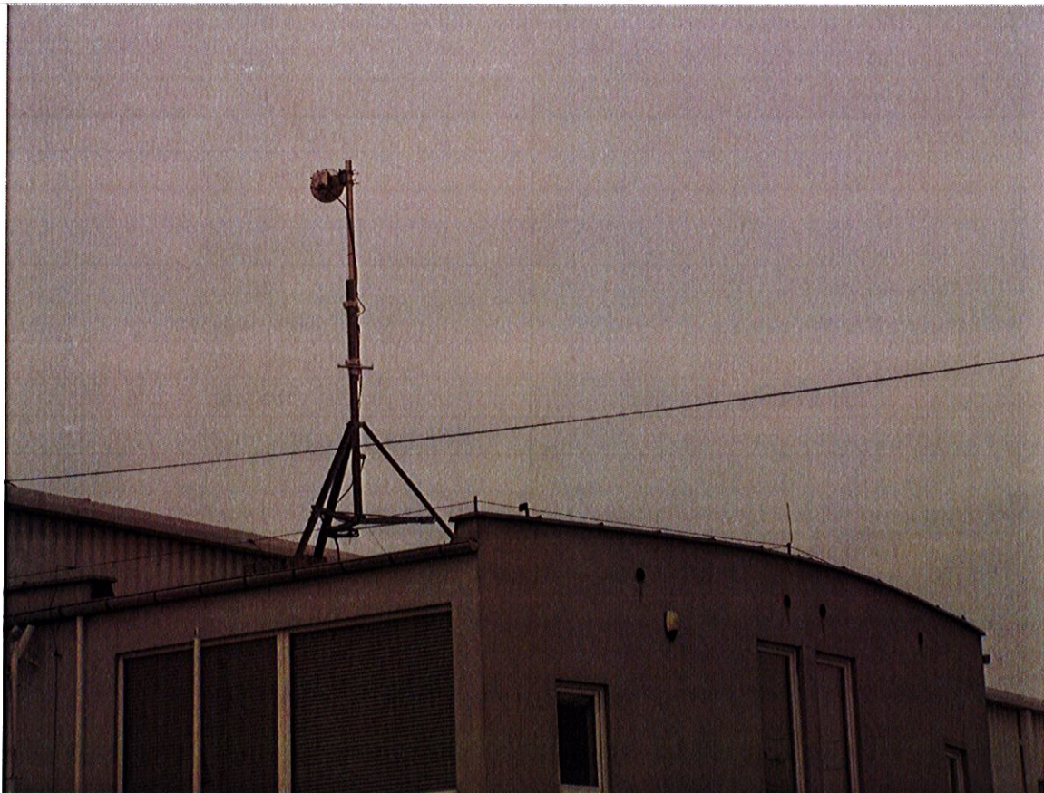
Fot. 1. OM Długołęka / ul Wrocławska 33 – widok anteny Emitel na dachu budynku